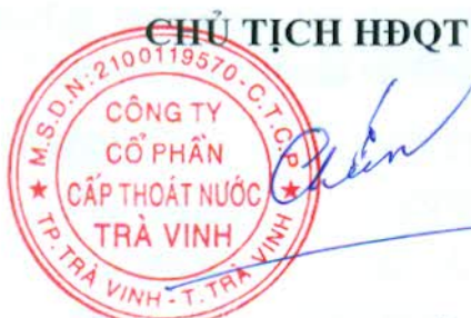
Trương Công Chiếm

Biên bản kiểm phiếu kết thúc vào lúc 16h giờ 10 phút cùng ngày, bao gồm 04 trang, được các thành viên tham gia kiểm phiếu cùng nhất trí và ký tên vào biên bản. Biên bản này được lập thành 02 bản và lưu tại Văn phòng Công ty./.